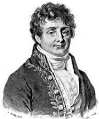
Jean Baptiste Joseph Fourier (Auxerre, 1768 – Parigi, 1830)